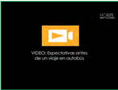
Duración del video: Aproximadamente 25 segundos